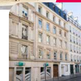
Investissement déjà réalisé : Immeuble Berryer, 75008 Paris**