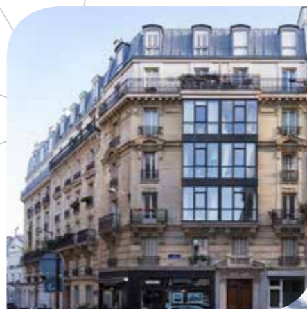
Investissement déjà réalisé : Hégésippe Moreau, 75018 Paris**