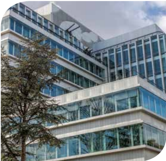
NEWTIME (SCI PREIM NEWTIME) NEUILLY-SUR-SEINE (75)