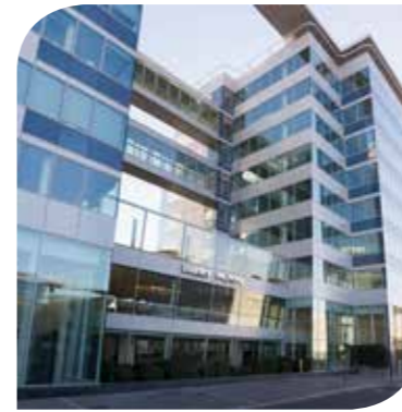
WEST PLAZA - COLOMBES (92)

HQE Exceptionnel, BREEAM Excellent, HQE, Exploitation, BBC