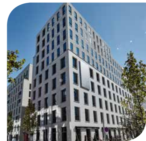
ARDEKO (SCI ARDEKO) - BOULOGNE-BILLANCOURT (92)