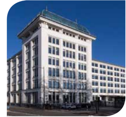
IN & OUT (SCI BOULOGNE LE GALLO) BOULOGNE-BILLANCOURT (92)

Certifié HQE Exceptionnel, BREEAM Very Good, LEED Platinum