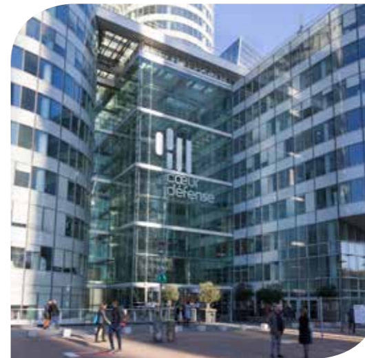
COEUR DÉFENSE (SCI HO LD) - COURBEVOIE (92)